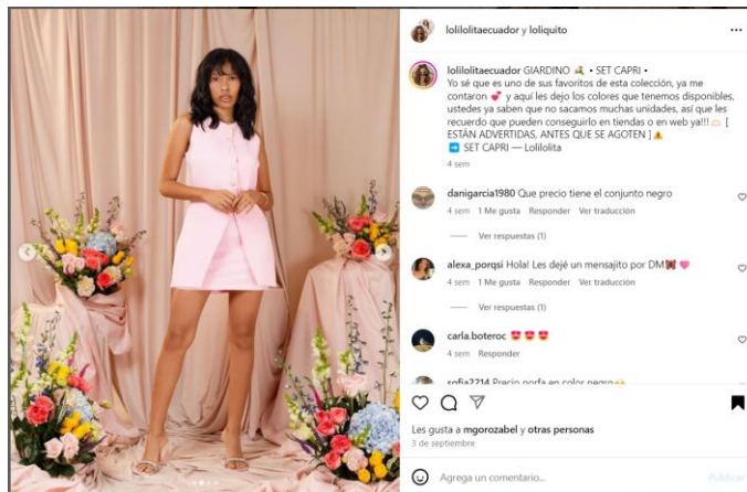
Imagen de la Publicación: