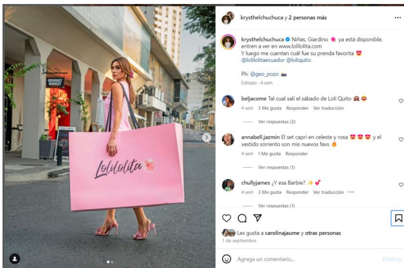
Imagen de la Publicación: