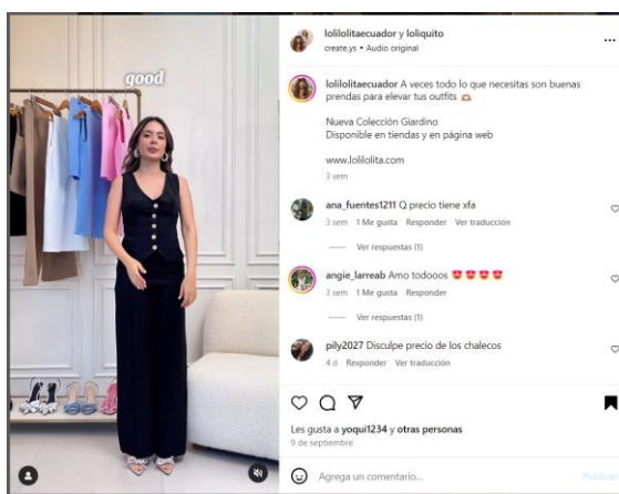
Imagen de la Publicación: