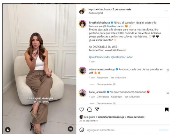
Imagen de la Publicación: